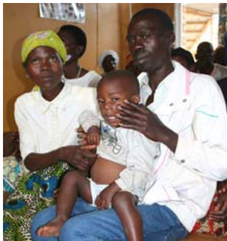
Drogas antirretrovirales permiten que esta pareja en el hospital Kabutare, Rwanda, pueda permanecer viva y criar a su hijo.

Combinar los servicios de lucha contra el VIH/SIDA con aquellos relacionados con la salud reproductiva y materna, nutrición y otras enfermedades como paludismo y tuberculosis, solucionaría una falencia de larga data que hasta la fecha afecta a numerosos programas nacionales de lucha contra el VIH/SIDA.